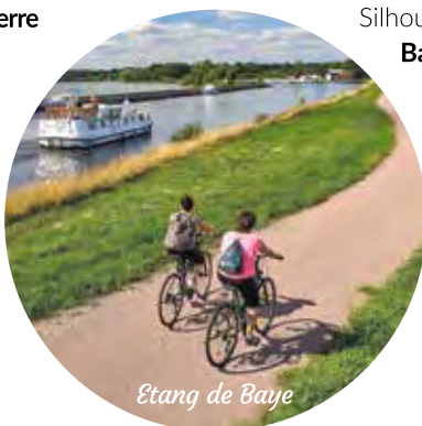
Etang de Baye

Fahren Sie weiter die Yonne stromaufwärts, um Auxerre und die berühmten Weinbaugebiete Chablis und Auxerrois zu entdecken. Dann beginnt der Canal du Nivernais . Die Winzerdörfer ziehen vorbei, wie etwa St. Bris oder Irancy, die versteckt zwischen Weinbergen und Kirschbäumen liegen.