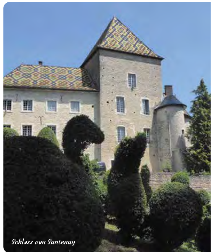
Schloss von Santenay